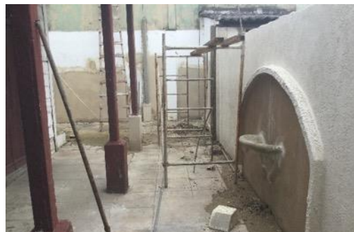
Travaux dans la cour de la Casa Amarilla

Pour améliorer l'accueil, pouvoir développer les activités et renforcer la structure, nous avons entamé des travaux en janvier 2018 grâce à votre générosité . S'ils ne sont pas terminés à 100%, le financement de ce projet est assuré.