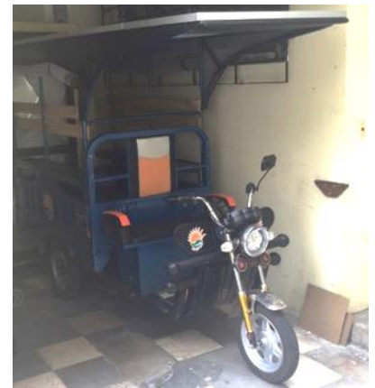
La motoneta est déjà très utilisée

Le transport est un vrai sujet ici, du fait de l'état des routes mais aussi des véhicules. Pour répondre aux besoins de la paroisse, nous avons investi en Mars dans une motoneta à énergie solaire pour transporter charges légères et passagers. C'est aussi une belle économie de carburant, dont le prix avoisine ceux pratiqués en France!