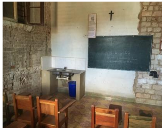
Salle de classe du soutien scolaire

Le permis de construire devrait arriver sous peu et les travaux commencer dans la foulée.