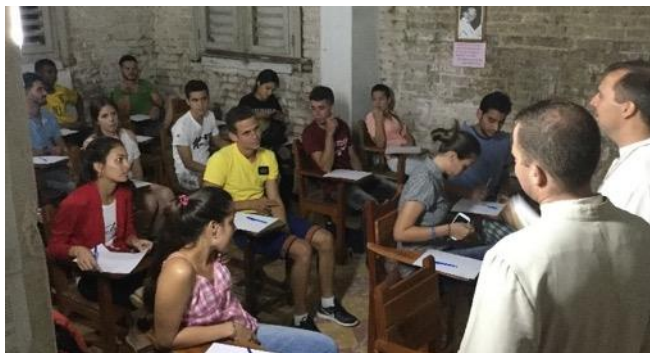
20 jeunes ont participé au concours

C'est un grande première ! Pour la première fois, des jeunes cubains de Placetas sont autorisés à se rendre aux JMJ qui auront lieu en Janvier prochain au Panama. Par soucis de neutralité, nous avons organisé un concours qui a permis de désigner les 10 heureux élus à qui la paroisse va financer le voyage (600 € par jeune en plus de leur effort personnel, ce qui est impossible à récolter pour eux).