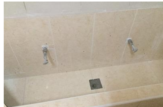
Les lavabos ont été installés à hauteur d'enfant

Le mobilier adapté à la petite enfance est en cours de construction et la phase de recrutement du personnel (5 personnes dont une directrice) a déjà commencé.