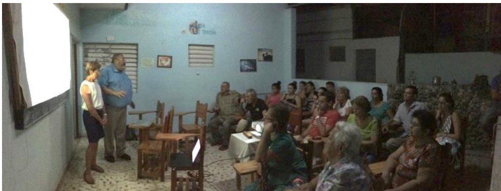
Les CADI en pleine formation à Falcon