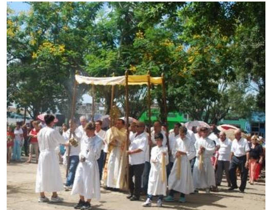
La procession du Saint Sacrement pour la Fête-Dieu a rassemblé plus de 400 personnes

Les mois de mai et juin à Placetas laissent peu de répit aux paroissiens et à leurs pasteurs : Fête-Dieu avec sa caravane de premiers communiant, et sa procession eucharistique dans les rues de Placetas, de Báez et de Falcón ; fêtes patronales des chapelles de la Mina (Sainte Rita), de Zaza (Sacré-Cœur) et de Miller (Corpus Christi), de la Legua (Saint Antoine de Padoue) et de Falcón (Saint Jean-Baptiste). Beaucoup de réjouissances, marquées cependant cette année par des pluies torrentielles et des inondations dans tout le centre du pays. Les maigres récoltes prévues pour l'après-Cyclone Irma n'en seront que davantage amoindries, et cela n'augure rien de bon pour les plus démunis.