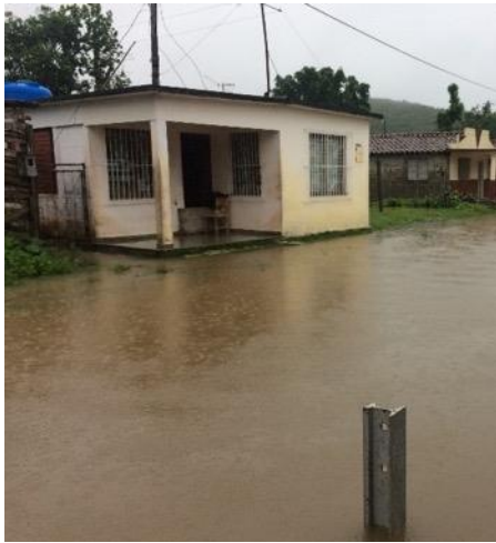
Les récentes fortes pluies ont provoqué d'impressionnantes inondations