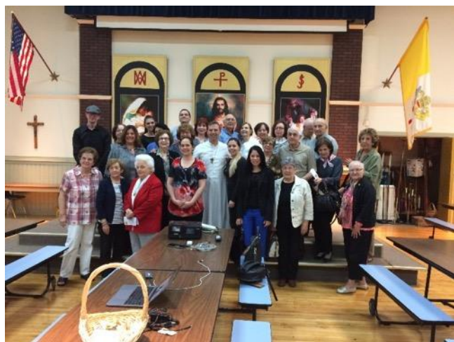
Photo de groupe avec nos bienfaiteurs cubains de New York