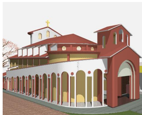
Projet de Chapelle du quartier Amador

De même, le toit de la chapelle de San José mérite une refonte en profondeur ! Et nous n'évoquons pas ici la chapelle du Reparto Amador , en ruine après des années d'abandon et qui doit être reconstruite à 100%.